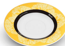
SPODEK ŻÓŁTY, PORCELANA*