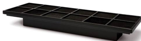
EKSPOZYTOR PŁASKI, DREWNO

Na 6 puszek (11798), na 12 puszek (11797)