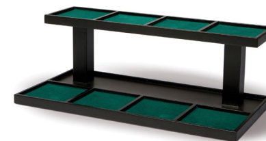
EKSPOZYTOR SCHODKOWY, DREWNO

Na 6 puszek (11798), na 12 puszek (11797)