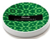
TALERZYK / PRZYKRYWKA ZIELONA, PORCELANA*