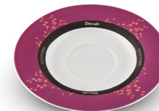
SPODEK BORDOWY, PORCELANA*