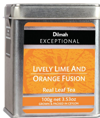
Herbaty sypkie w metalowych puszkach

Dilmah Exceptional to dowód, że herbata nie jest démodé – to napój XXI wieku, który wybornym smakiem i jakością potrafi przykuć uwagę każdego Gościa, także należącego do młodszego pokolenia.