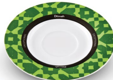
SPODEK ZIELONY, PORCELANA*