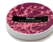
TALERZYK / PRZYKRYWKA BORDOWA, PORCELANA*