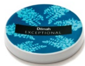
TALERZYK / PRZYKRYWKA MORSKA, PORCELANA*