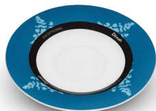
SPODEK MORSKI, PORCELANA*