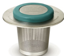
ZAPARZACZ "EFFORTLESS" ZE STALI NIERDZEWNEJ

zaparzac (10965), wymienna pokrywka (12938)