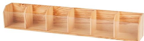
PREZENTER OTWARTY PUSTY, BAMBUS