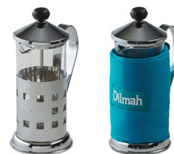
THETIERA, SZKŁO (350 ML)

zaparzac (10965), wymienna pokrywka (12938)