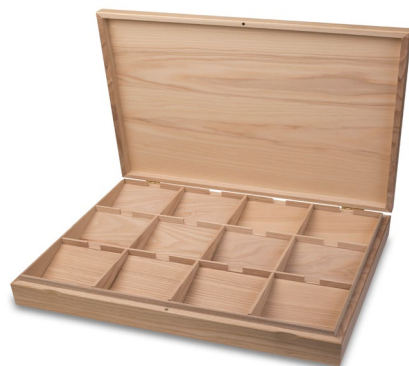
PREZENTER ZAMYKANY PUSTY, DREWNO JESION