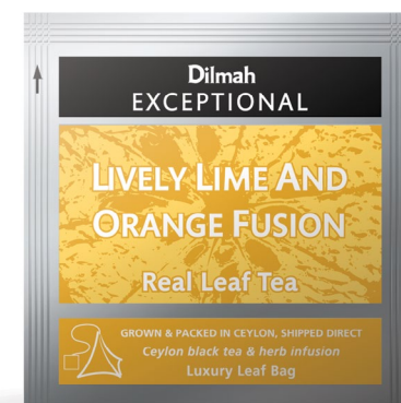
Herbaty w torebkach stożkowych w kopertach