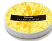
TALERZYK / PRZYKRYWKA ŻÓŁTA, PORCELANA*