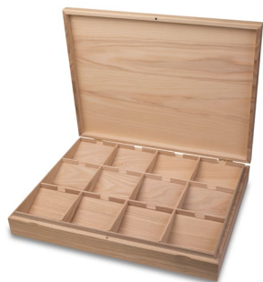
PREZENTER ZAMYKANY PUSTY, DREWNO JESION