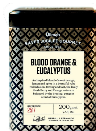
Herbaty sypkie w metalowych puszkach

Świeże, produkowane z surowców z pojedynczych plantacji, w 100% czyste cejlońskie herbaty Dilmah zostawiły trwały ślad na rynku. Aby uczcić 25 aromatycznych, herbacianych lat, postanowiliśmy stworzyć coś naprawdę spektakularnego. Naszym celem było pokazanie gatunkowej różnorodności herbat Dilmah oraz nadanie tej liczącej 5000 lat roślinie akcentu rodem z XXI wieku. Wprowadzając kolekcję Silver Jubilee Gourmet, świętujemy herbaciany kobierzec tkany przez Dilmah od ponad dwóch dekad.