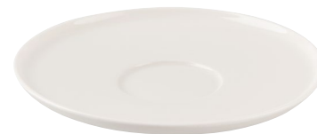
SPODEK POD FILIŻANKĘ, PORCELANA*