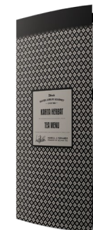
MENU SILVER JUBILEE GOURMET