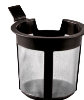
ZAPARZACZ DO CZAJNIKA*